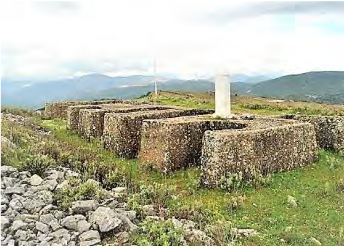
Το Μπιζάνι σήμερα

Ο Ελληνικός Στρατός μπήκε στα Γιάννενα σαν ελευθερωτής και όχι σαν κατακτητής αφού η διαταγή του Στρατηγείου καθόριζε να «...να μη πειραχθεί κανένας Τούρκος πολίτης ή στρατιωτικός...». Οι Γιαννιώτες μεθυσμένοι από τον αυθόρμητο ενθουσιασμό και την απεριγράπτη χαρά τους παραμέρισαν κάθε διάθεση αντεκδίκησης προς τους πρότερους δυνάστες τους και εξάντλησαν αυτή πάνω στο «μισητό» σύμβολο της πολύχρονης υποτέλειας, γεμίζοντας τους δρόμους και τις πλατείες της πόλης με χιλιάδες κουρελιασμένα κόκκινα φέσια. Τελικά η επίσημη προσάρτηση του υπολοίπου τμήματος της Ηπείρου και ο καθορισμός των συνόρων στα σημερινά περίπου όρια, έγινε λίγο αργότερα μέσω των συνθηκών του Λονδίνου αρχικά και του Βουκουρεστίου στη συνέχεια μετά τον τερματισμό και του Ελληνο-Βουλγαρικού πολέμου που επακολούθησε, χωρίς δυστυχώς να συμπεριληφθούν περιοχές με Ελληνικούς πληθυσμούς που είχε ήδη απελευθερώσει ο Ελληνικός Στρατός (Χειμάρα, Κορυτσά, Αργυρόκαστρο, Άγιοι Σαράντα).