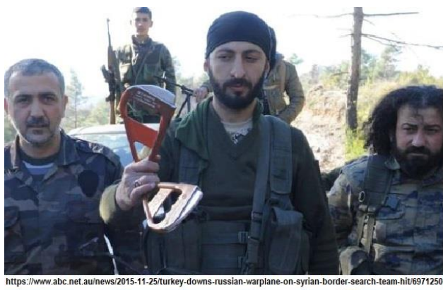
https://www.abc.net.au/news/2015-11-25/turkey-downs-russian-warplane-on-syrian-border-search-team-hit/6971250 November 24, 2015. Syrian Turkmen rebels show off part of a Russian airman's parachute after a Russian Sukhoi Su-24 was shot down by a Turkish F-16 on the border

Τρία χρόνια αργότερα (5/8/2018), συνελήφθη στη Γεωργία, ο καταζητούμενος