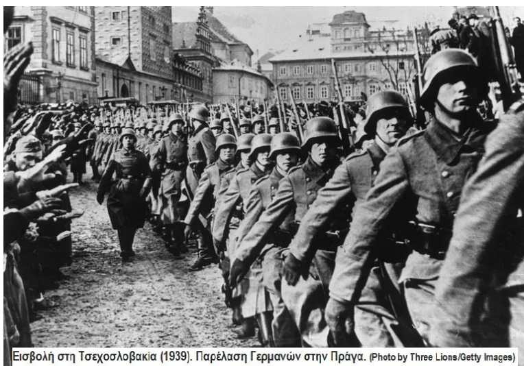
Εισβολή στη Τσεχοσλοβακία (1939). Παρέλαση Γερμανών στην Πράγα.

Ο Άγγλος πρωθυπουργός, Νέβιλ Τσάμπερλεν, υποστηρικτής της πολιτικής του κατευνασμού, δεν αντέδρασε, απεναντίας, υπέγραψε με τη Γερμανία, Ιταλία και Γαλλία, τη «Συμφωνία του Μονάχου» με την οποία αναγκαζόταν η Δημοκρατία της