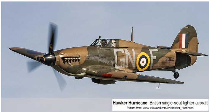
Hawker Hurricane, British single-seat fighter aircraft