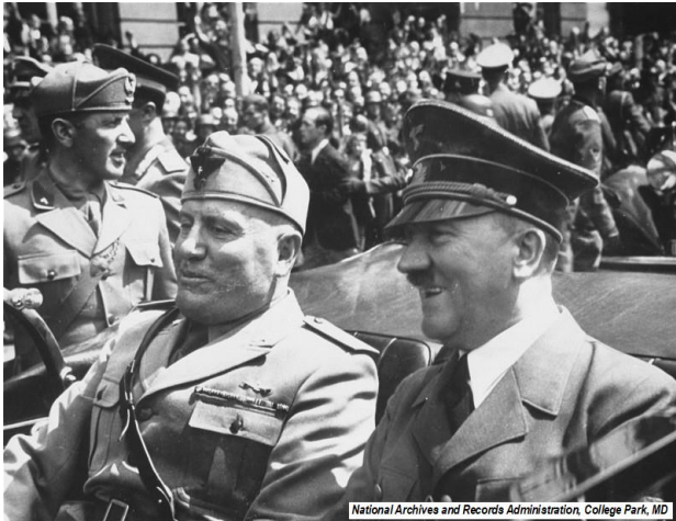
Οι ηγέτες του Άξονα, Αδόλφος Χίτλερ και Ιταλός πρωθυπουργός Μπενίτο Μουσολίνι, συναντιούνται στο Μόναχο, Γερμανία, 1940

Η Ιταλία, σύμμαχος της Γερμανίας από το 1936 (Άξονας Ρώμης-Βερολίνου), μπήκε στον