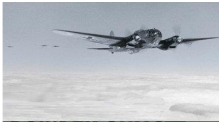
6 Απριλίου 1941, Η Γερμανική επίθεση στην Ελλάδα. Οι γραμμές ανεφοδιασμού, αεροδρόμια & λιμάνια σφυροκοπούνται από αέρος

Κορυζή διακοίνωση που έλεγε πως, σκοπός της Γερμανικής επίθεσης ήταν να διώξουν από την Ελλάδα τους 62.000 άνδρες και τα αεροπλάνα των Βρετανών που είχαν σταλεί