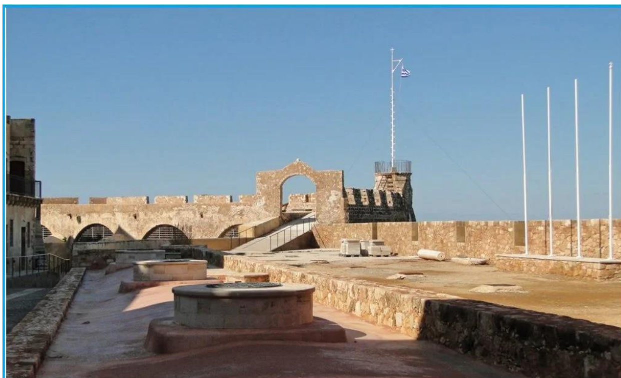
Ο γωνιακός πύργος του Φρουρίου Φιρκά (στα τούρκικα σημαίνει στρατώνας) όπου υπεσάλη η σημαία της «Κρητικής πολιτείας» και υψώθηκε η Ελληνική την 1/12/1913 κατά την επίσημη τελετή της ενσωμάτωσης της Κρήτης στην Ελλάδα.