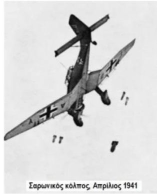
Σαρωνικός κόλπος, Απρίλιος 1941

Πανικός, φόβος και απογοήτευση παντού. Τόσα πυροβόλα να βάλουν και να μην ρίξουν ούτε ένα αεροπλάνο! Η αντιαεροπορική μας άμυνα, αν και από τον Πειραιά μέχρι τα Μέγαρα υπήρχαν αρκετά πυροβολεία και πυροβόλα, αποδείχτηκε ανεπαρκής.