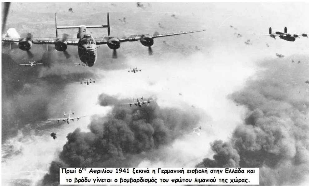
Πρωί 6 ης Απριλίου 1941 ξεκινά η Γερμανική εισβολή στην Ελλάδα και το βράδυ γίνεται ο βομβαρδισμός του πρώτου λιμανιού της χώρας.

Μέχρι τη δύση του ήλιου, είχαν φύγει από λιμάνι 11 πλοία που έπλευσαν σε γειτονικούς όρμους ενώ μέσα στο λιμάνι παρέμειναν 24 ατμόπλοια, 7 μικρότερα, αρκετά βοηθητικά και πολλές φορηγίδες.