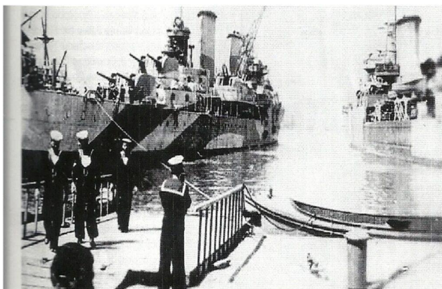
Πρωί 6 Απριλίου 1941, HMS AJAX και HMAS Perth πρυμνοδετημένα στο λιμάνι του Πειραιά.