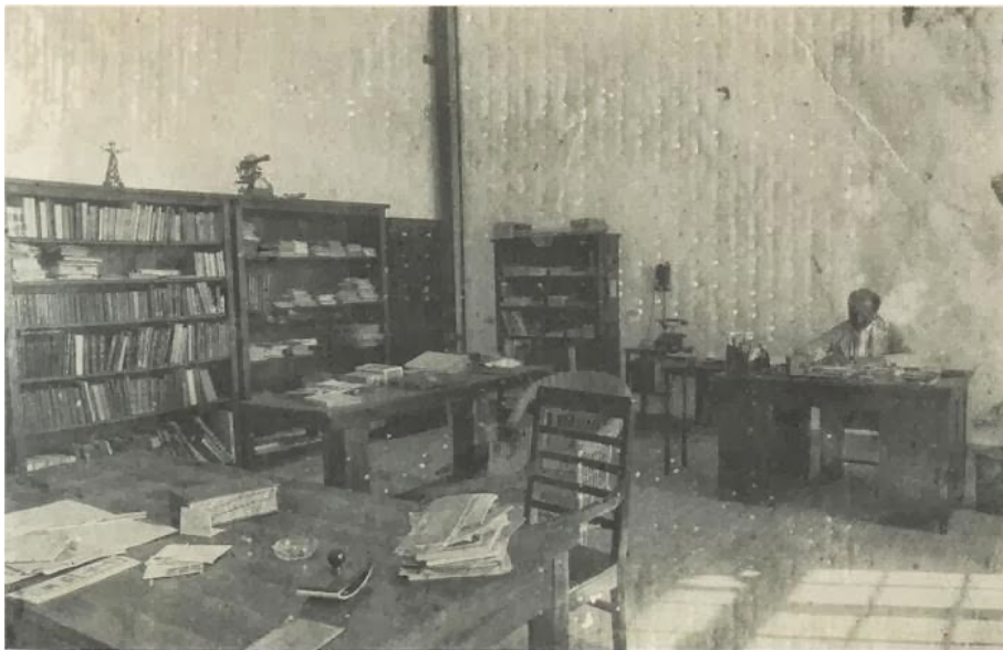
ΦΩΤΟ 3: Το γραφείο του Καραθεοδωρή στο πανεπιστήμιο Σμύρνης