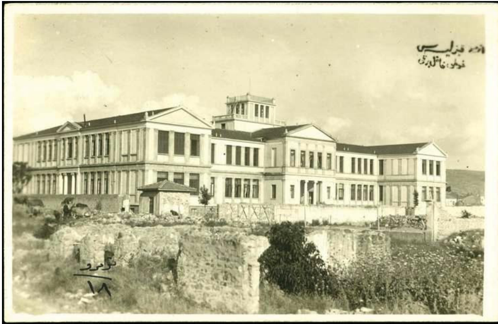
ΦΩΤΟ 2: Οι κτιριακές εγκαταστάσεις του ΙΠΣ